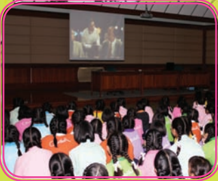
ฐานเครื่องใช้ไฟฟ้าเพื่อโลกสวย

วันที่ 2 พฤศจิกายน 2555 กระทรวงพลังงานมาเผยแพร่ความรู้ให้กับน้องๆ โรงเรียนนารีรุฒของเรา ในด้านการอนุรักษ์พลังงานและการใช้พลังงานอย่างมีประสิทธิภาพ การจัดกิจกรรมโดยแบ่งเป็นฐานต่างๆ