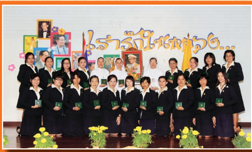
ครูที่ได้รับเครื่องราชอิสริยาภรณ์ ชั้นที่ 4 จตุตถดิเรกคุณาภรณ์