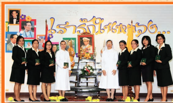
ครูที่ได้รับเครื่องราชอิสริยาภรณ์ ชั้นที่ 5 เบญจมาภรณ์คุณาภรณ์